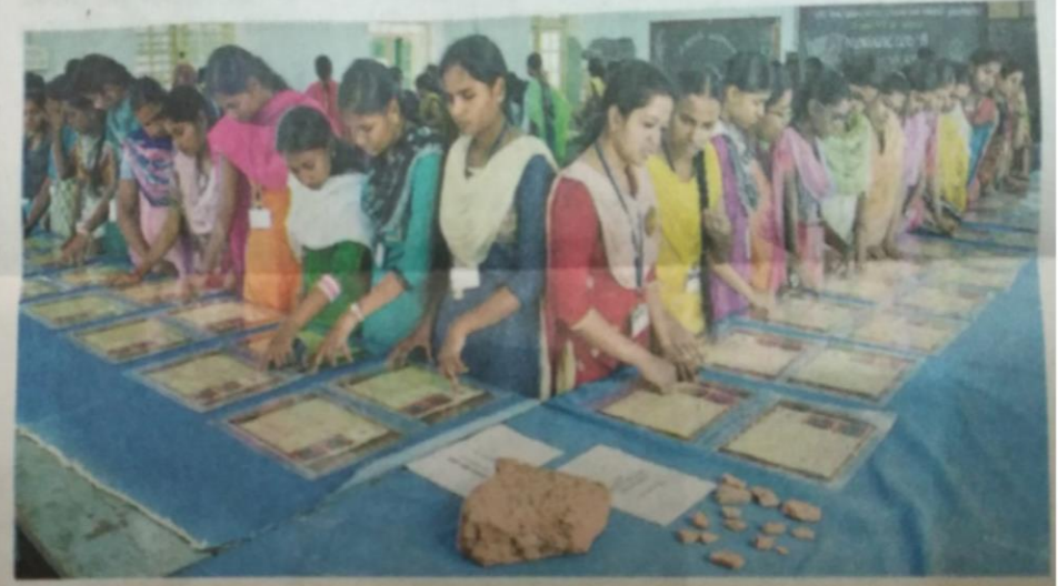
உ டுமலை ஜி.வி.ஜி. விசாலாட்சி மகளிர் கல்லூரியில் நடந்த, நாணய கண்காட்சியை பார்வையிடும் மாணவியர்.