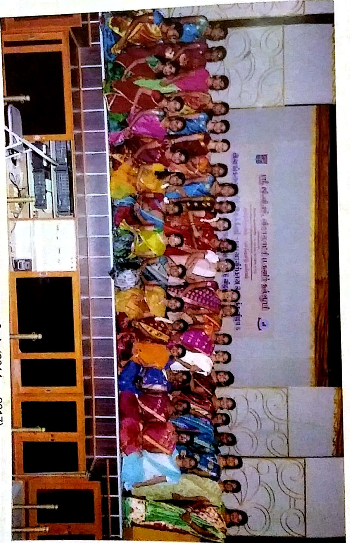
இளங்கலை தமிழ் முதலாண்டு மாணவியர் (2014 - 2017)